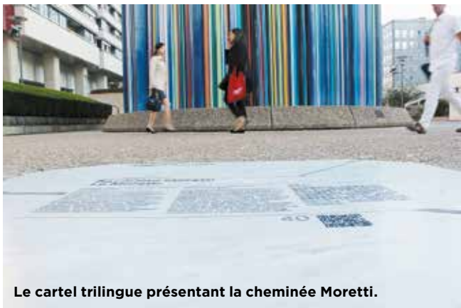
Le cartel trilingue présentant la cheminée Moretti.